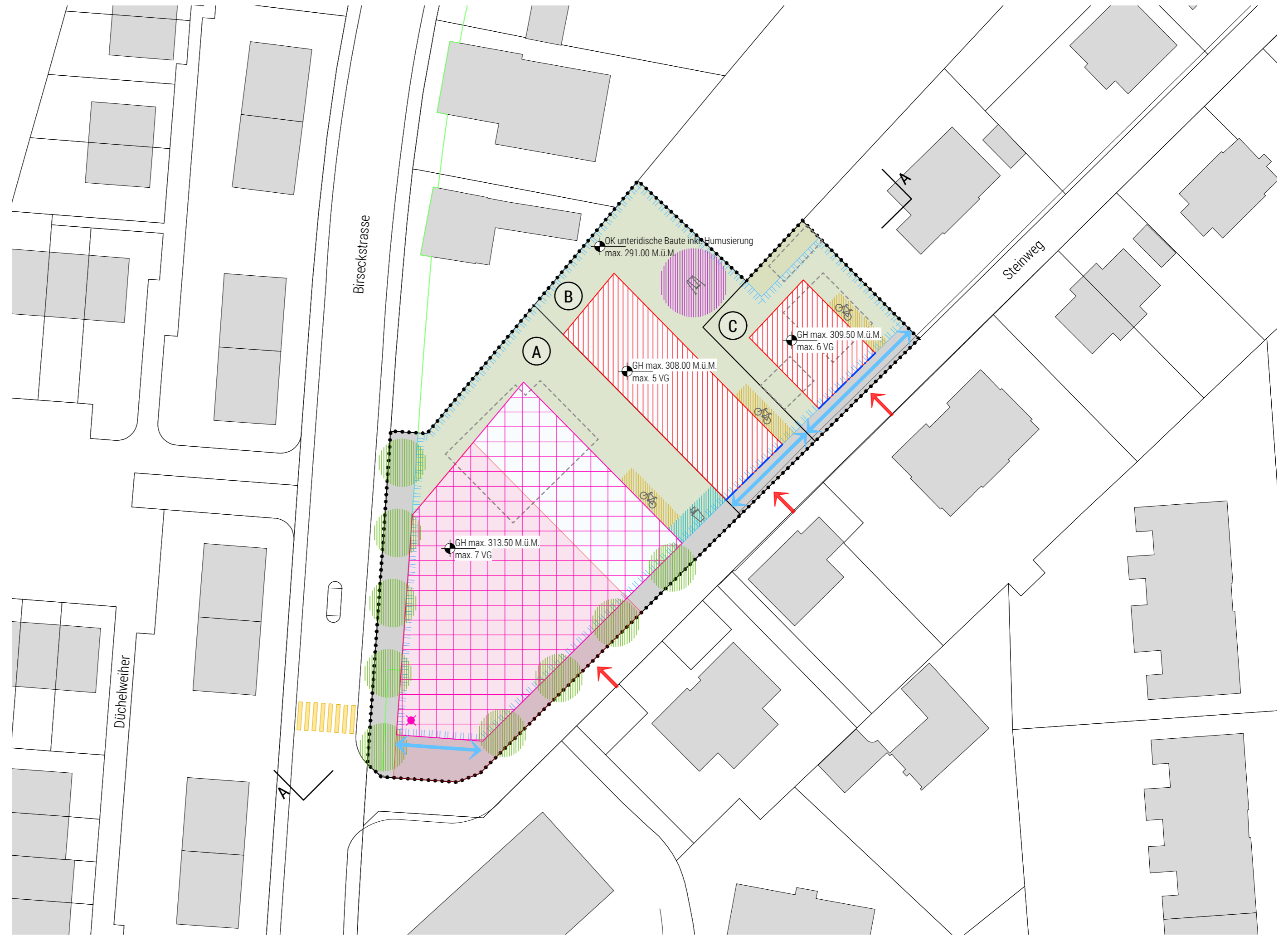
Grundriss in Situation | 1:500

Exemplar für die Mitwirkung und die kantonale Vorprüfung Stand 14.09.2020