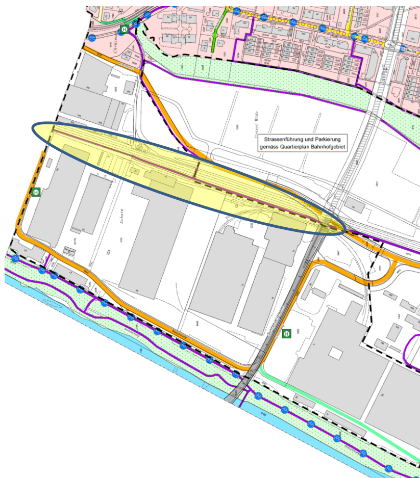
Abbildung: Ausschnitt aus dem rechtskräftigen SNP Arlesheim mit dem von der Mutation betroffenen Abschnitt