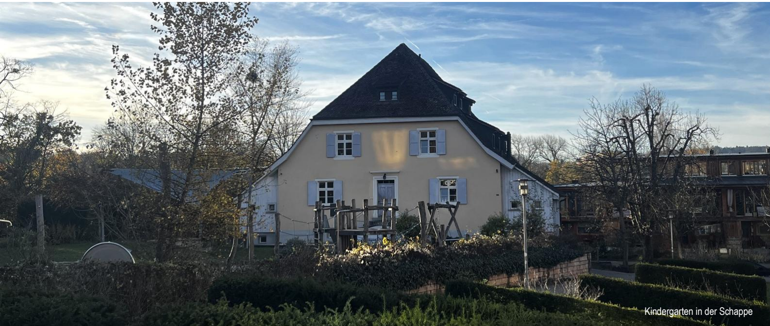
Kindergarten in der Schappe