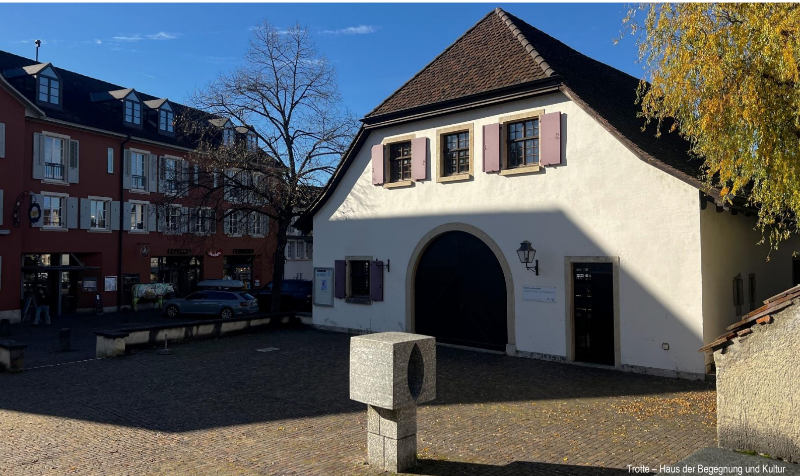
Trotte – Haus der Begegnung und Kultur