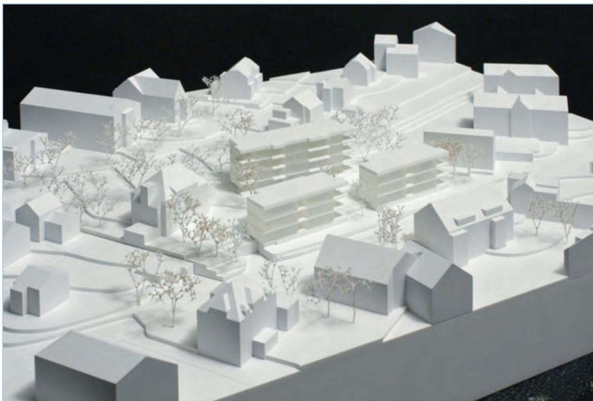
Modell: Sicht aus Westen. Die beiden kleineren Bauten im Vordergrund, das grössere Gebäude im Hintergrund. Villa links davon.

Modell und Pläne werden an der Gemeindeversammlung ausgestellt