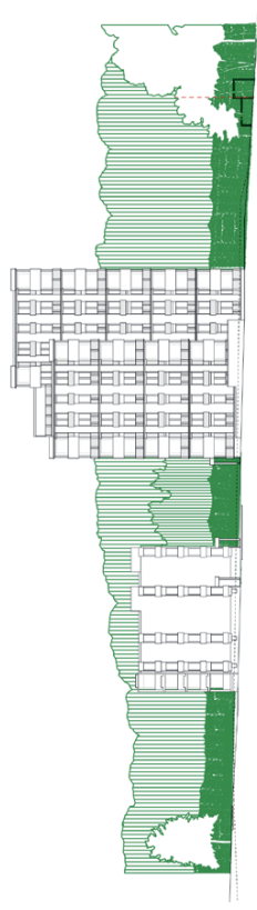
Richtungswisende Konzeption der Gebäudegestaltung, Ansicht West