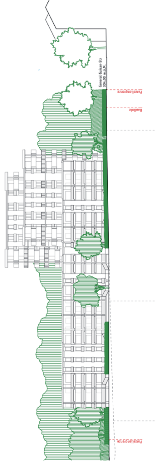
Richtungswisende Konzeption der Gebäudegestaltung, Ansicht Süd