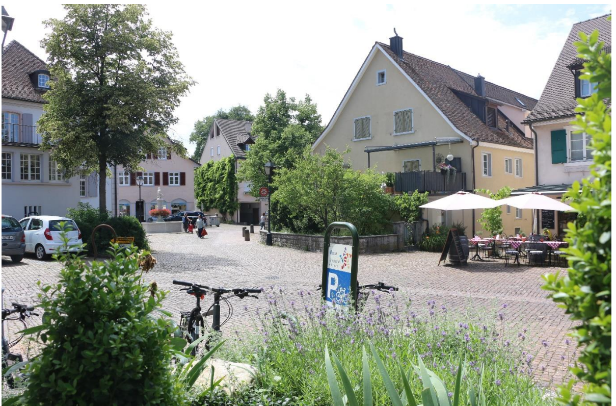
Abb. 3 Ortskern Arlesheim