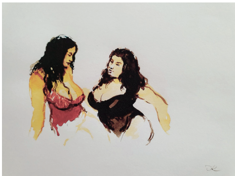
Hommage aux Femmes Gedenkausstellung Jürg Keller