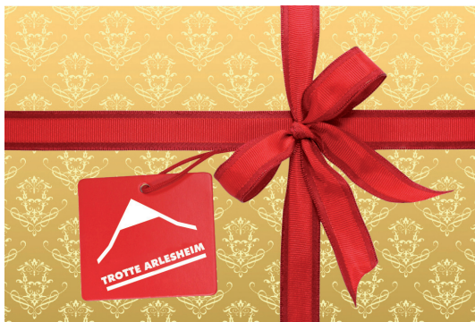
Weihnachtsausstellung Arleser Freizeitkünstlerinnen und -künstler

Wir nehmen gern Ihre Anmeldung entgegen (je nach Grösse der Exponate vier bis sechs Werke). bis 20. Oktober 2020 bei Svetlana Ehinger, Tel. 079 782 35 93 oder s.ehinger.doneva@gmail.com